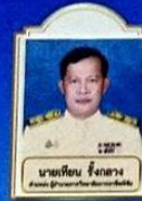
ฝ่ายวิชาการ